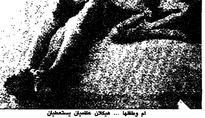
تستعطي كسرة خبز